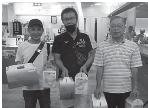
【団体戦優勝：㈱ヤスタ】