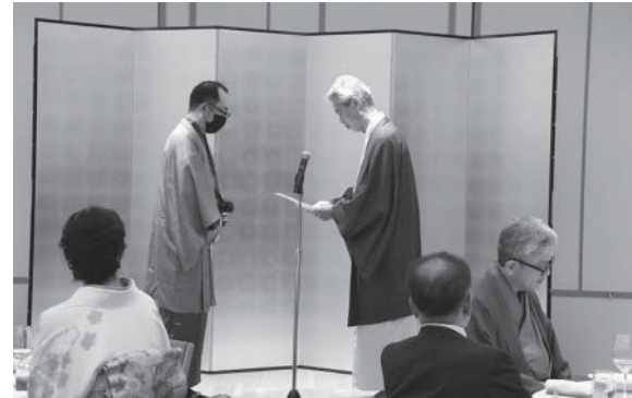
【役員・委員に対する感謝状の贈呈】